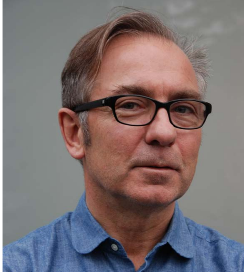
12 | Wiel Arets tussen kunstenaar en ingenieur